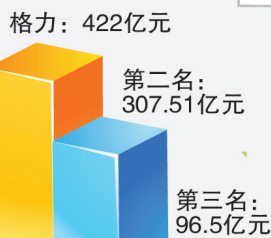
2008年度 空调行业销售业绩对比

国内一空调厂商多款睡眠空调产品,构成侵犯格力(专利号:ZL200710097263.9)发明专利权。责令其立即停止销售格力享有专利权的产品。并赔偿格力经济损失200万元人民币。