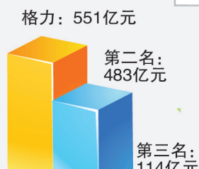
2010年度 空调行业销售业绩对比

以上数据源自“中国证监会”——《上市公司年报》;刊登于《中国证券报》、《上海证券报》,数据权威、公正、客观、可查,具有法律效力,真真正正的第一。