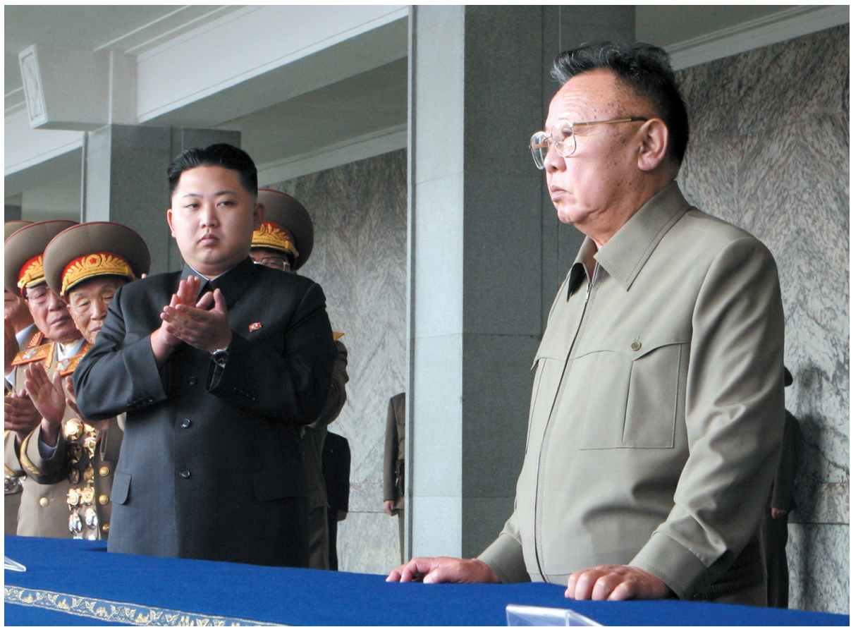
资料图:2010年10月10日,朝鲜举行盛大阅兵式,庆祝朝鲜劳动党成立65周年。这是朝鲜最高领导人金正日(右一)等朝鲜党和国家领导人在阅兵式开始前走上主席台。

另外,由于金正日已经任命其三子金正恩为继承人,金正恩已经掌握大权,被任命为金正日治丧委员会主席,权力继承格局短期内不会有大的变动。不过,在朝鲜未来发展中是否会采取改革措施,外界颇为关注。有分析说,以后朝鲜将偏重于经济改革,但不会有重大改变。至于朝鲜与周边国家的关系,预计短期内也不会有太大变动。