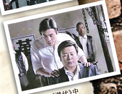
吉思光在《潜伏》中扮演盛乡(前者)