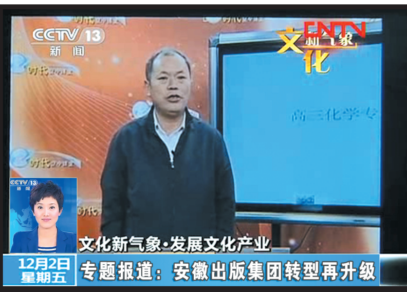
▲ 高考机“移动课堂”化学课，惊现央视新闻