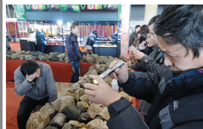
“赌石”现场,有兴奋有失落