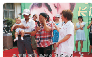
孕育家园启动仪式现场感人一幕