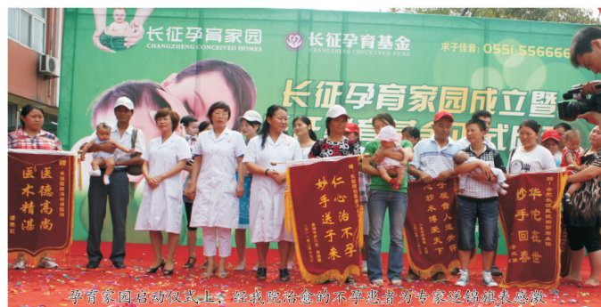
孕育家园启动仪式上，经我院治愈的不孕患者为专家送锦旗表感谢

设好，把“长征孕育基金”生育关怀活动开展好，为“稳定低生育水平，提高新出生人口质量”更好推动人口和计划生育工作作出新贡献！