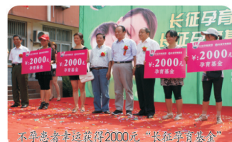
不孕患者幸运获得2000元“长征孕育基金”

注：孕育基金最高可以申请5000元援助，详情请拨打：0551-5566 666或登录长征微创医院官方网站：www.ahczyy.cn咨询！