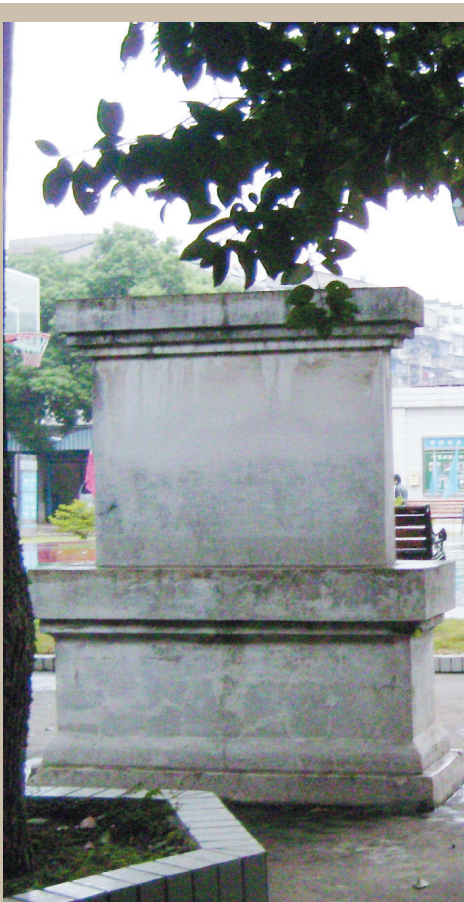
供水集团内陈家老屋石碑

高登科多希望女婿陈独秀能一路科举或者守着祖业过日子。然而，门前大江流，滚滚波涛激荡了陈独秀广阔的胸襟，他无法安定，更无意潜心科举。当母亲去世后，嗣父陈昔凡要求他与兄长庆元一起去东北抄抄文稿时，他选择了去日本留学。