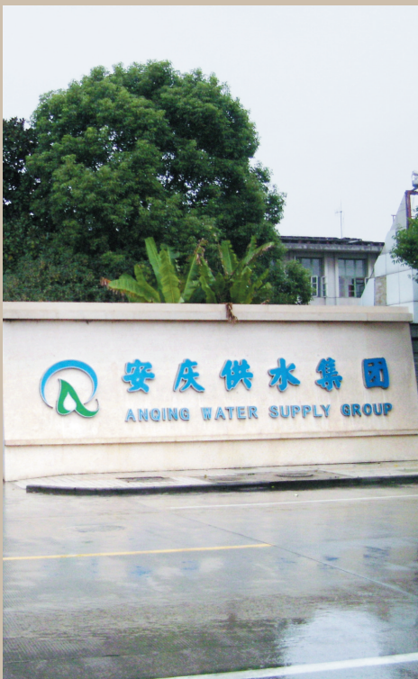
安庆供水集团大门