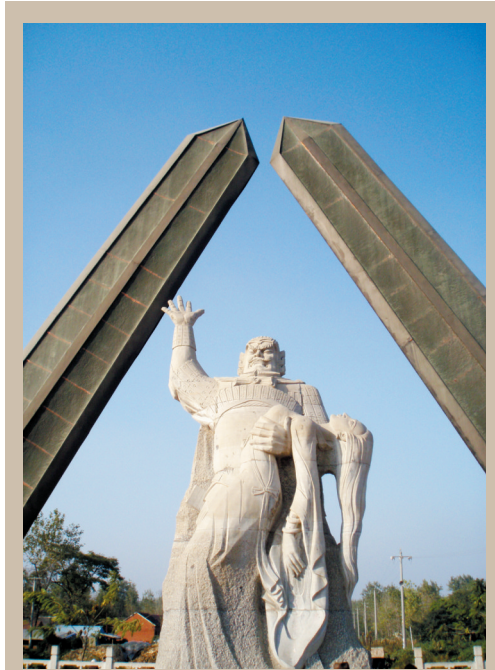
霸王怀抱虞姬雕像