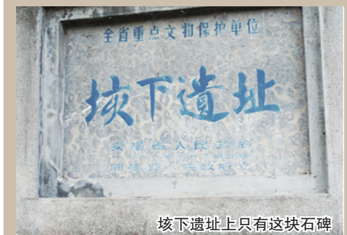
垓下遗址上只有这块石碑