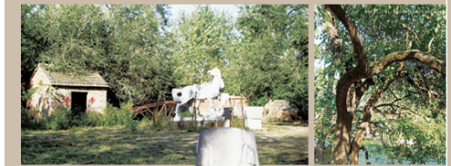
村中的乌骓马石像