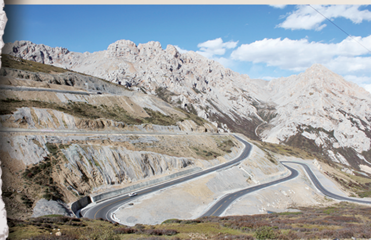
安徽援建的川黄公路(援建办)