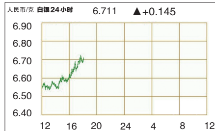
白银24小时纽约现货价格走势