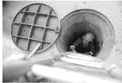
为保障秋季市政下水管道正常使用及道路安全,近日工作人员对省城马鞍山路地下管道进行维护修补工作。维护路段从马鞍山路与九华山路交叉口至马鞍山路与太湖路交口,预计工程两日内可以完成。