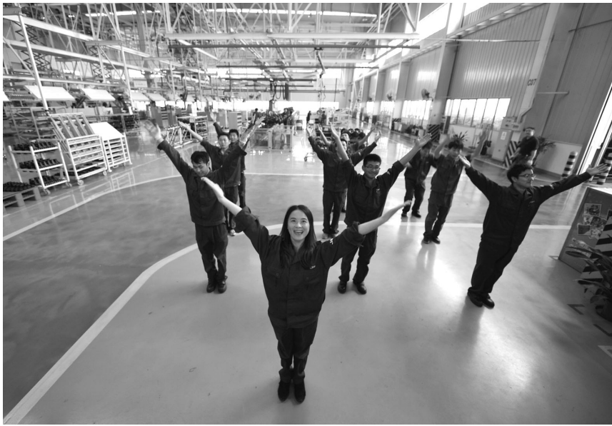
近日,合肥市江淮汽车厂内工人们做起了第九套广播体操。由于工作繁忙,许多人被亚健康困扰着,工厂在抓好生产管理的同时,特地安排职工在工作间隙做操锻炼,劳逸结合。

昨天上午,省城瑶海区首批52新闻发言人正式亮相,该52人基本上都是各乡镇、开发区、区直单位和有关部门的主要负责人,或熟悉本单位工作的副职人员。据介绍,此次瑶海区首批基层新闻发言人“集训”重点内容为如何做新闻发言人,着力培养新闻发言人的新闻素养和与媒体沟通的能力、网络舆情应对、舆情信息的采集及如何做好新形势下的媒体应对与危机管理。 解琛 夏漫红 记者 杨璨