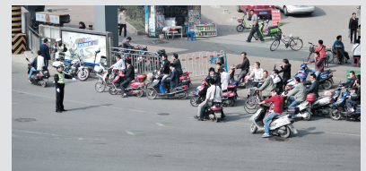
停车位置远远越过停车线