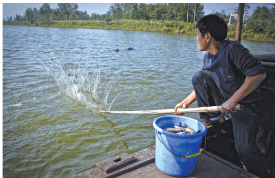
用竹竿击打水面，“呼唤”江豚