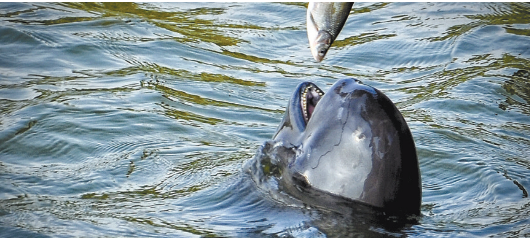
保护区内的江豚已经习惯了人工喂食