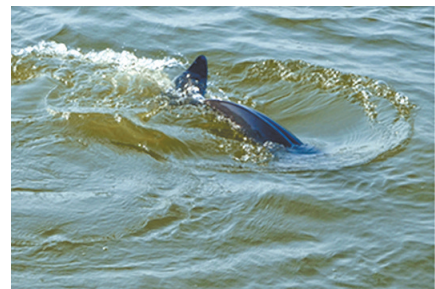
江豚在保护区游弋，如今长江广阔水域里的“江豚舞”已经罕见