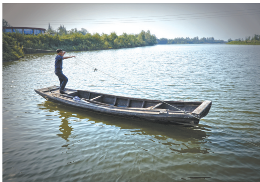
为不干扰江豚，行船靠绳拉

江豚是世界自然保护联盟的濒危物种，目前整个长江流域仅有1000多条，而且数量还在下降。圆圆的脑袋，微微翘起的嘴角，江豚天生就会微笑。当栖息地被破坏、生活环境恶化，将它们逼至走投无路时，人们啊，你可曾察觉它微笑背后的哀伤和隐喻？