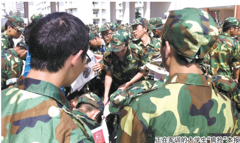
正在军训的大学生“疯抢”本报

昨日一大早,本报安排巢湖站组织11名工作人员对特刊进行分拣,分别到巢湖世纪新都、东方景苑等高档小区、商场、机