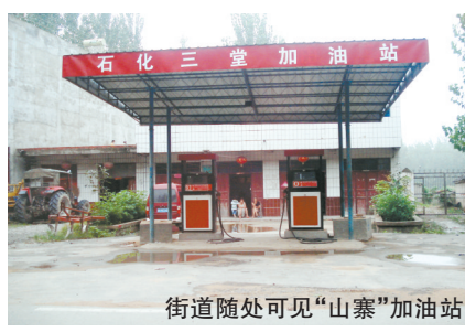
街道随处可见“山寨”加油站

近日，记者不断接到太和县三堂镇部分居民打来的电话，反映他们全镇有8家违法加油站，更夸张的是，三堂镇政府门前不到一公里的街道上就有4家。