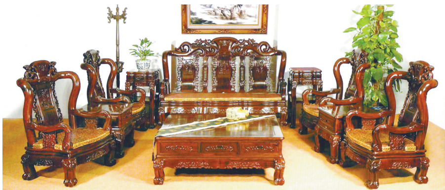
资料图片:红木家具