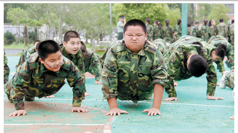
昨日,合肥市某军事院校训练场上,黄山路小学的“小兵”们正像士兵一样进行体能训练。 程继标 薛辉 记者 刘元媛 文/图