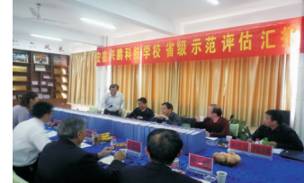
安徽省教育厅专家评估组听取汇报