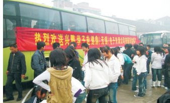
2007级电子专业部分学生去健鼎(无锡)电子有限公司带薪顶岗实习