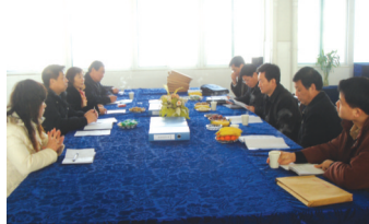
安徽省教育厅副厅长江春(右中)来我校视察

3、奖励措施及优惠政策:凡被我校录取的新生,农村、县镇户口及城市家庭经济困难的学生,前两年享受国家助学金每年1500元;对家庭生活困难的特困生,凭相关证明符合免学费政策的免除学费;学校实行奖学金制度,奖励品学兼优的学生。①新生在6月8日至8月28日期间来校报名,免费参加“科技夏令营活动”;②6月8日前报名缴清第一年费用者优惠300元,7月8日前报名缴清第一年费用者优惠200元,8月8日前报名缴清第一年费用者优惠100元。以上优惠不重复计算,不含高中后一年制就业强化班。