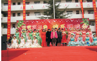
丰富多彩的文娱演出