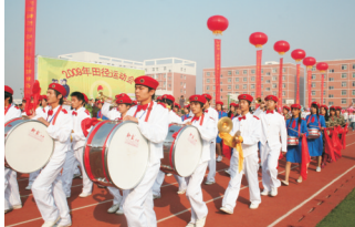
2009年田径运动会开幕式