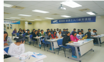
学校领导看望07级就业于上海三星真空电子器件有限公司的学生