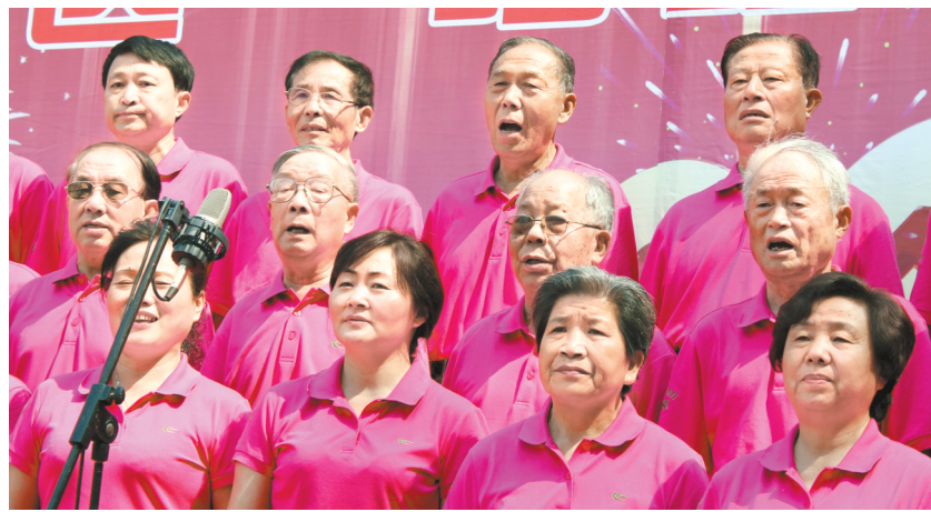
昨日,在合肥市蜀山区青阳路社区举办的“唱红歌、颂党恩”联欢会上,来自合肥干休三所、四所的72名曾经参加过抗日战争、解放战争和抗美援朝的老革命,再次高唱他们终生难忘的革命歌曲。郎章正 记者 程兆文/图

的小挫折和不如意。钟教授建议,一旦发现孩子思想和心理健康中的苗头性问题,要及时沟通。要对孩子进行人生观、价值观的教育,让他们学会珍惜、热爱生命。