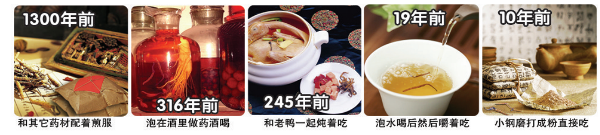
1300年前 和其它药材配着煎服 316年前 泡在酒里做药酒喝 245年前 和老鸭一起炖着吃 19年前 泡水喝后然后嚼着吃 10年前 小钢磨打成粉直接吃