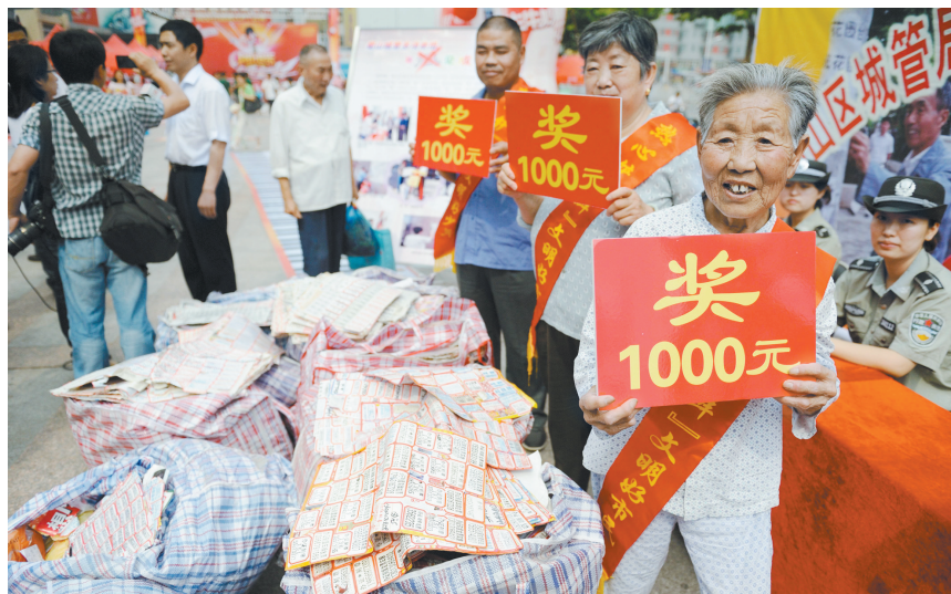
昨天上午,合肥市三里庵国购广场上堆放了几十蛇皮袋的“牛皮癣”广告,几位“铲癣大王”在自己的“战功”面前笑得合不拢嘴,分别被发给了1000元奖金。据了解,蜀山区城管局从2007年5月开始,开展了全民治“癣”有奖工作。4年多以来,1000多名热心市民获得奖励,发放奖品奖金合计25万多元。 沙先清 张前程 见习记者 杨臻/文

拥有安庆户口、生活在合肥的胡女士认为,光买房已是许多家庭的沉重负担,说合肥比北京生活好,也只是说合肥的环境、交通状况等较好。