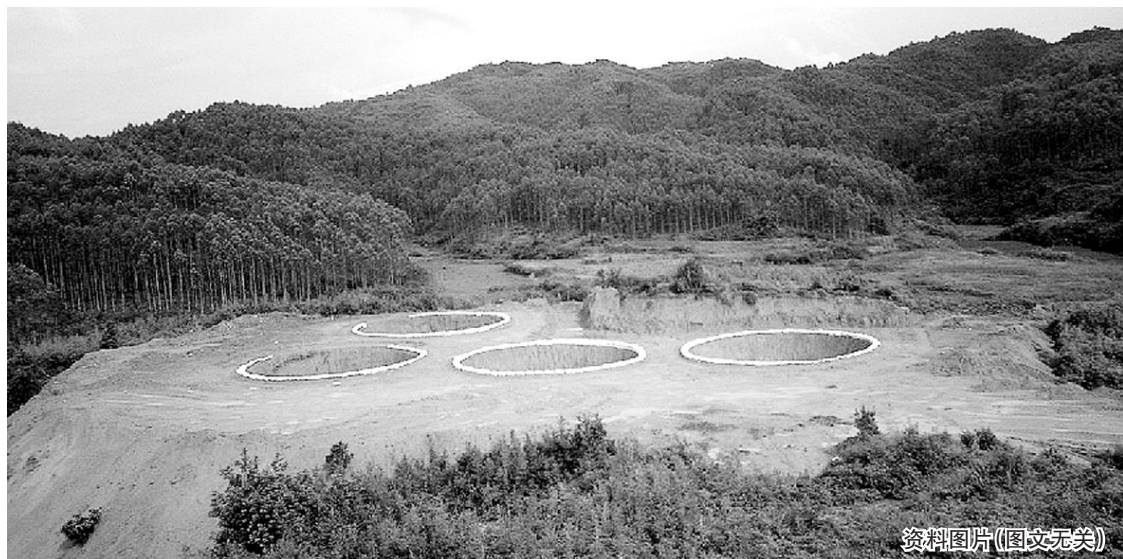
资料图片(图文无关)

包钢股份(600010)和攀钢钒钛(000629)公司6月1日与四川省攀枝花攀西开发区(攀西裂谷带)签订框架协议，总投资额约28亿元，建设攀钢钒钛稀土产业园项目。同时，攀钢钒钛稀土有限公司也揭牌成立。市场传言攀西开发区办公室透露，攀钢钒钛已与攀西开发区达成初步协议，将于近期择机签订投资开发世界第三大稀土矿攀西裂谷带特大型透石英正长岩-碳酸岩杂岩体的稀土矿，预计该矿轻稀土资源储量超过40万吨。