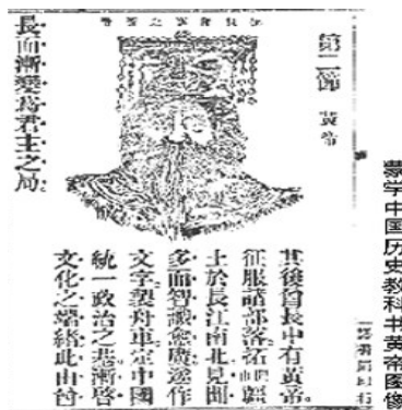
蒙学中国历史教科书黄帝图像