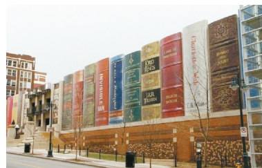
美国,密苏里州,社区书架