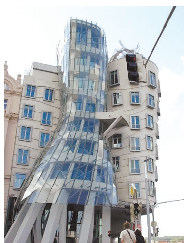
捷克共和国,布拉格,舞蹈大厦