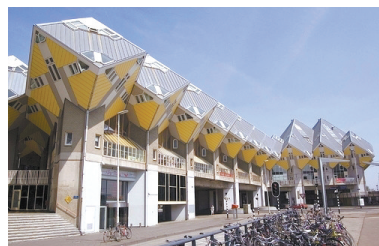
荷兰,鹿特丹,方块屋

无论在哪个领域总有那么一些与众不同,以下这些世界各地的奇特建筑告诉我们,对于建筑界来说,外貌也是很重要的。