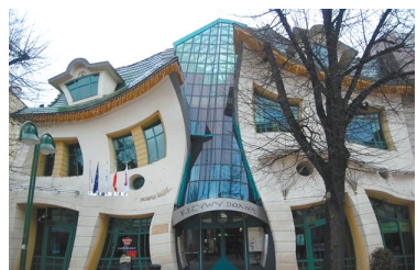
波兰,索波特,弯曲屋