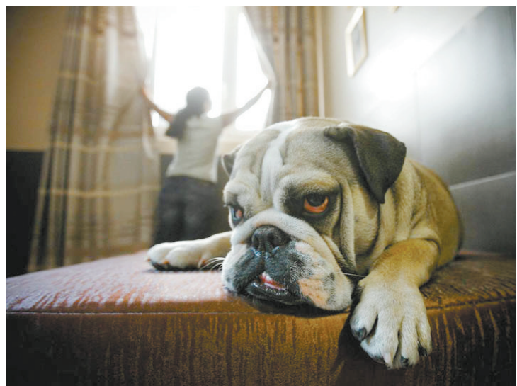
谁敢往前一步,我废了他!