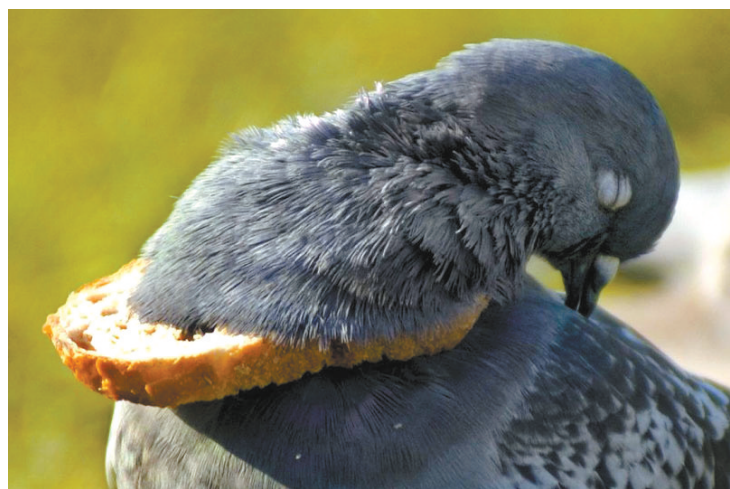
看得见吃不着,谁用这串面包勒死我得了