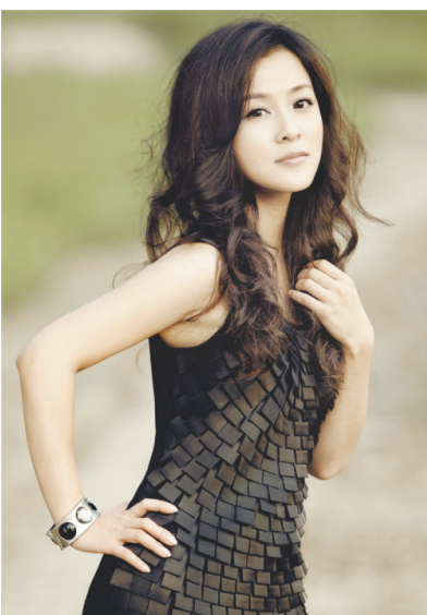
电视剧《闪婚》女演员刘芳毓