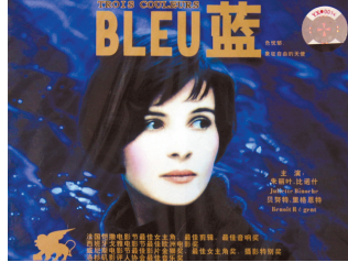
4 朱丽叶·比诺什，《蓝色》