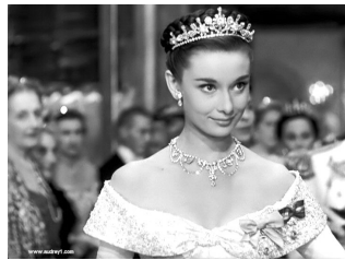
2 奥黛丽·赫本，《罗马假日》