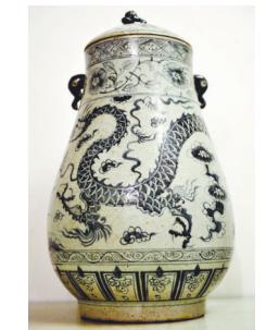
藏友朱先生藏品

星报鉴宝专家:器形敦重古拙,有厚重感。胎质一般,鉴定为康熙时期民窑作品。图片不能代替实物,建议参加星报5月份的现场鉴宝活动。