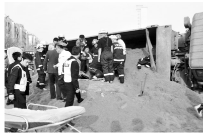
被困者被从轿车天窗中拽出

目前,包河交警大队正在调阅监控录像还原事发一幕,而运沙车是否涉嫌超载违规驾驶还在调查中。