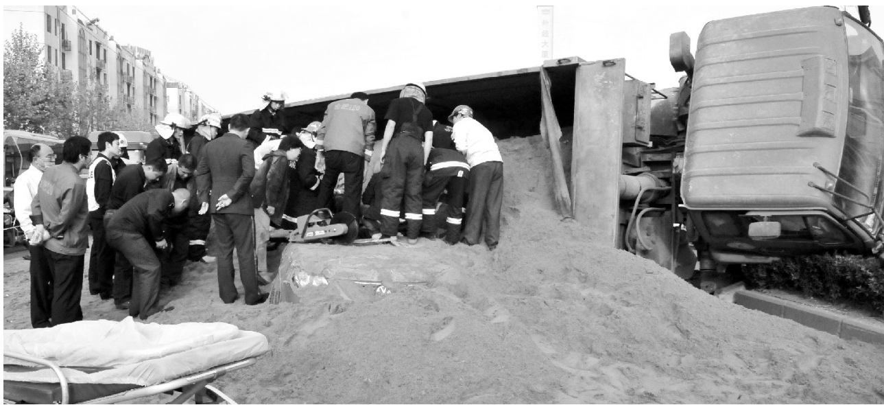
轿车遭黄沙活埋,众人合力施救