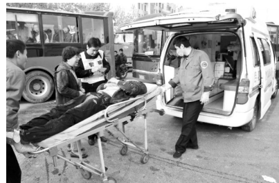
被困者被紧急送往医院