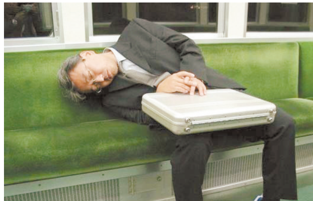
这样睡觉,底盘得多稳啊