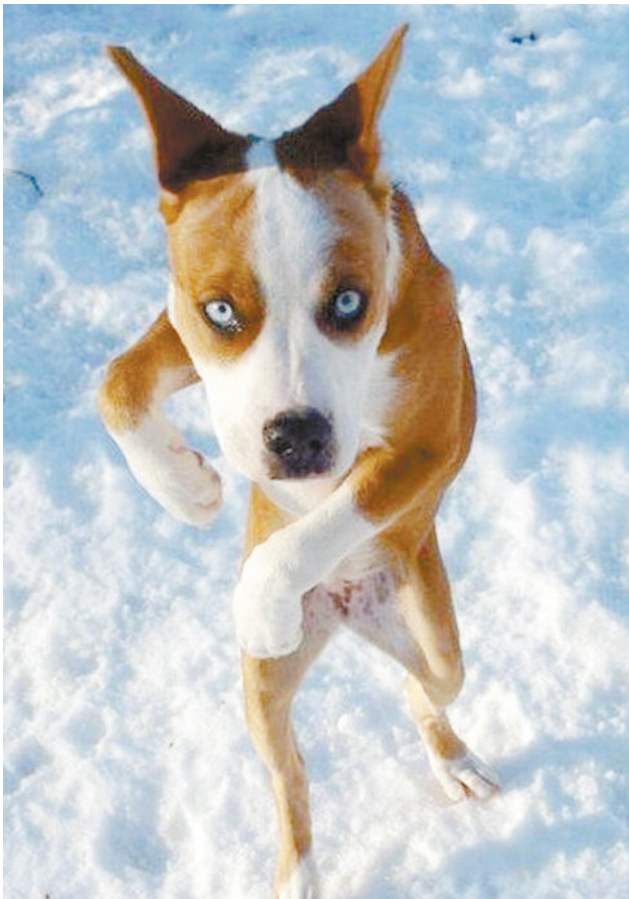
不要过来,我练过功夫的