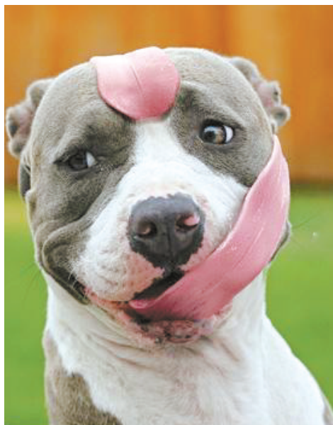
舌头太长也是一种苦恼啊