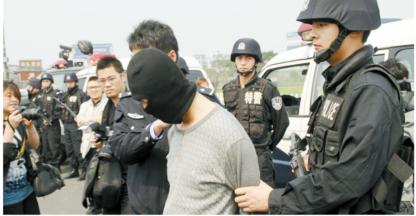
嫌疑人被押回案发地温州