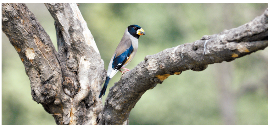
黑尾蜡嘴雀 性情外向的观赏鸟,是中国传统笼养鸟种。飞行迅速、两翅鼓动有力,在林内常一闪即逝。活泼而大胆,不甚怕人。