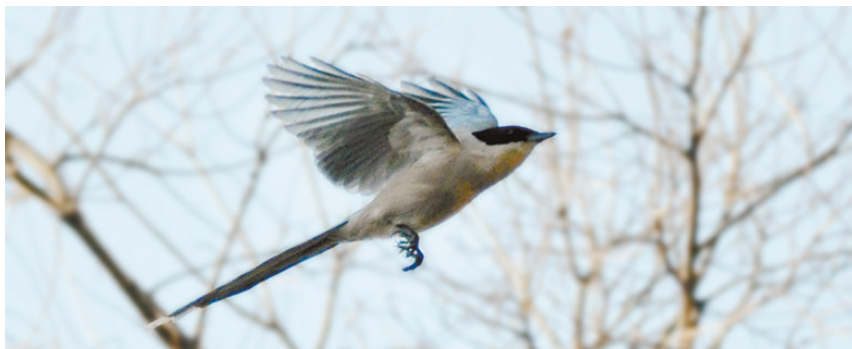
灰喜鹊 安徽省省鸟,鸣声宏亮且粗豪,是中国最著名的益鸟之一,在中国一些经济林较集中的地方,常有人工饲养灰喜鹊用来保护经济林。