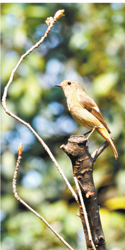
北红尾鸲 栖息于山地森林、灌丛地带,常立在突出的枝条上,尾上下颤动。取食昆虫及植物种子。

在“爱鸟周”里,记者走访了合肥多处公园,拍摄了这些鸟类,辨认一下,这些鸟类你见过吗?