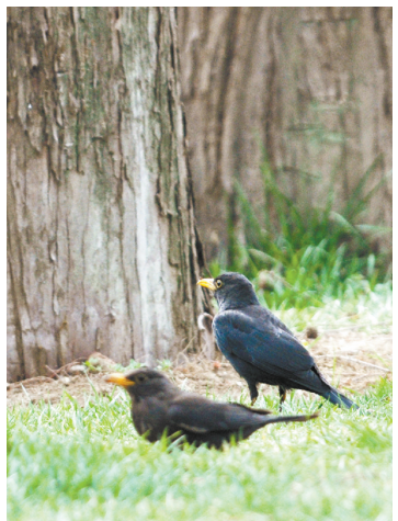
乌鸫 栖落树枝前常发出急促的“吱、吱”短叫声,并善仿其他鸟鸣。