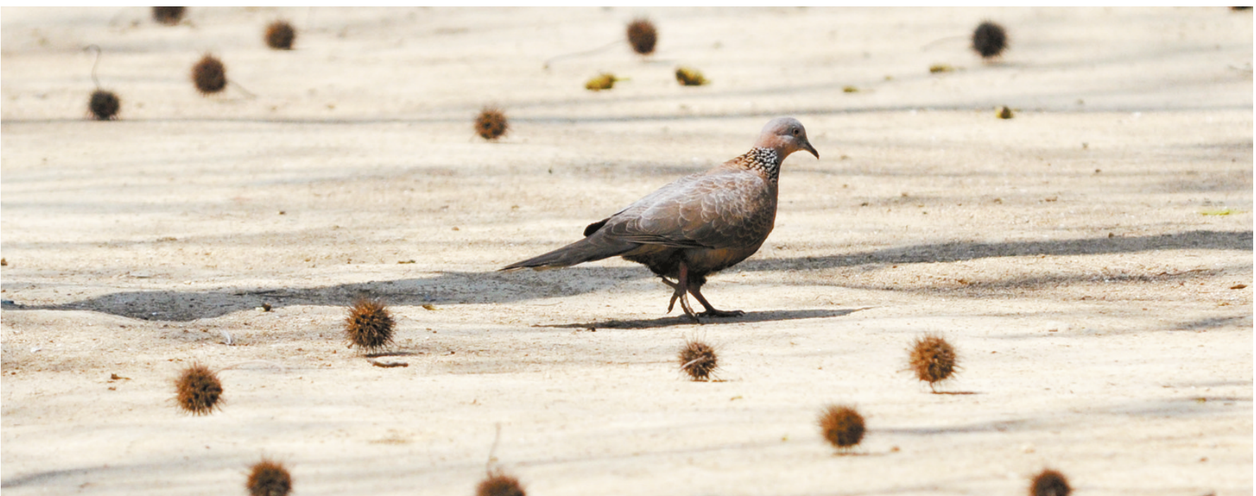
珠颈斑鸠 颈部有一黑色羽带并有白色斑点,很像珍珠,故得名。主要以植物种子为食,特别是农作物种子。通常在天亮后离开栖息树到地上觅食。