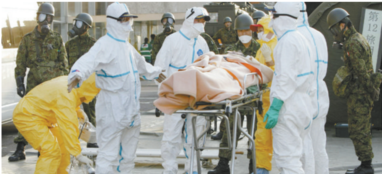
工作人员将一名疑似受到辐射患者送入救护车