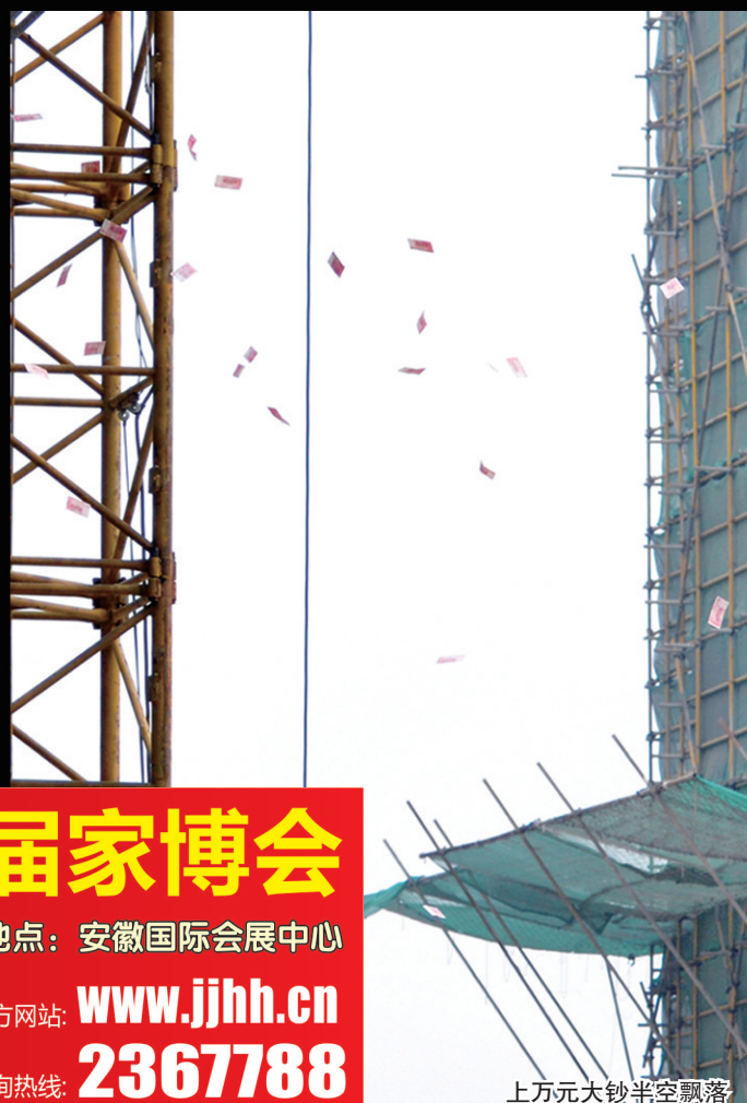
上万元大钞半空飘落