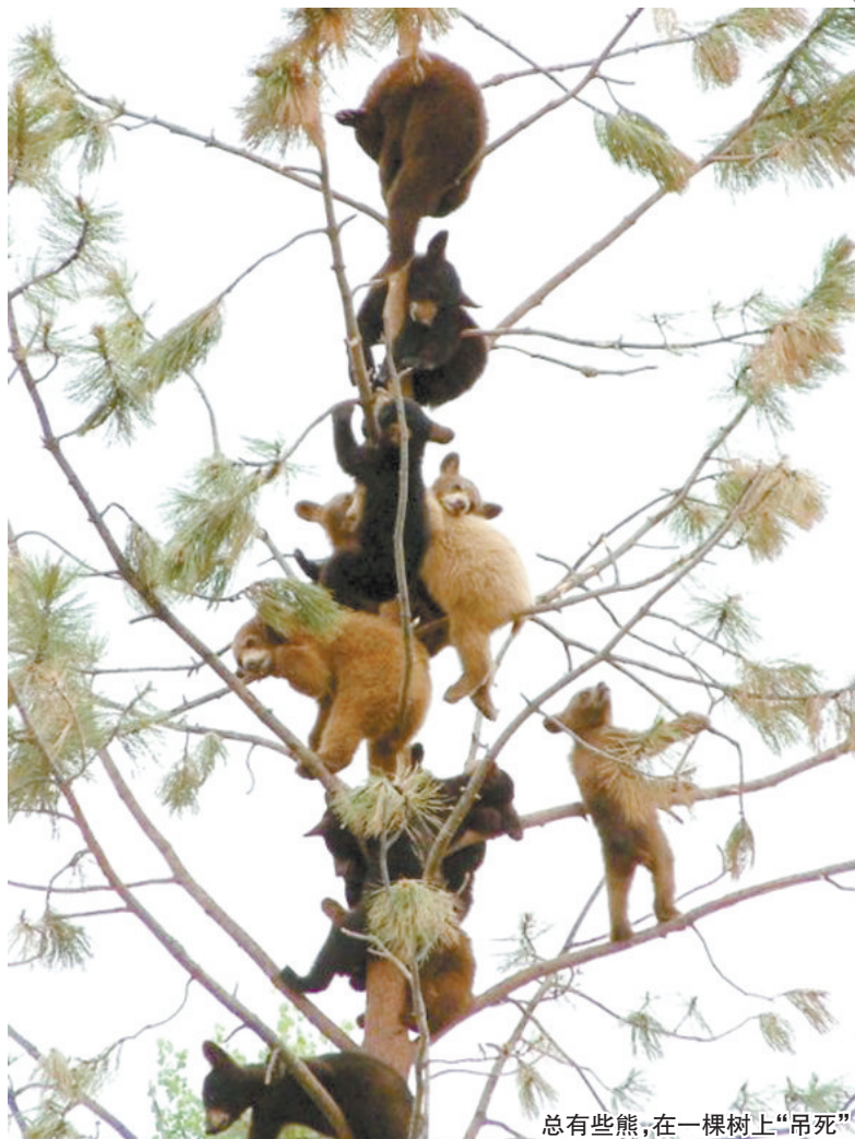
总有些熊,在一棵树上“吊死”