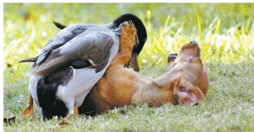
居然被一只鸭子占了便宜,今后在动物界怎么混……