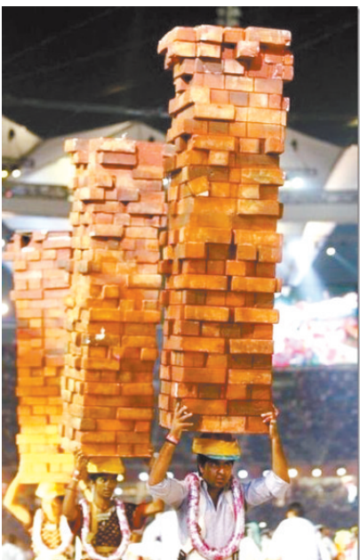
铁头功是这样炼成的