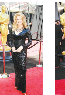
杰基·韦弗 这身塑料珠片从哪带来的回哪去吧!