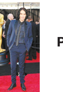
罗素·布兰德 一身蓝色礼服出场,算男装里稍有突破的了。