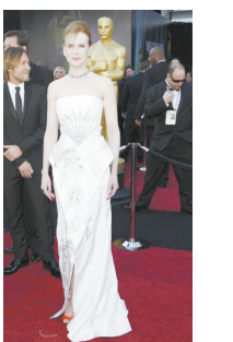
妮可·基德曼 今年奥斯卡红毯主题是大丰收么?!