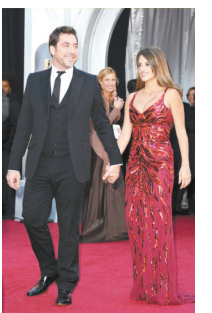
佩内洛普·克鲁兹 克鲁兹穿的是神马?马戏团借来的么?