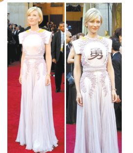
凯特·布兰切特 纪梵希的礼服,穿的很美,可谁这么缺心眼,来了个“勇”字?