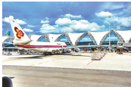
泰国苏汪纳蓬机场