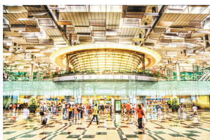
新加坡樟宜国际机场