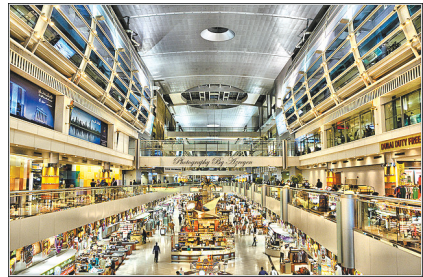
阿联酋迪拜国际机场

机场不止是旅途中的一个驿站,某种意义上说,它更是一道风景。以下图片是一次摄影展上艺术家眼中的亚洲各地机场风景。