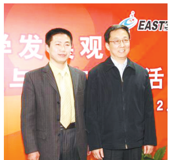
2009年2月,上海市长韩正接见鲁传江(左)