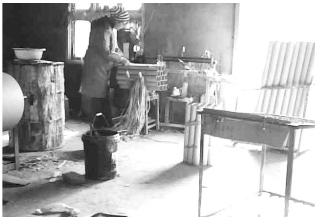
小作坊正忙着加工烟花爆竹半成品

易爆品,在生产环节存在着一定的危险性。因此,生产烟花爆竹的企业,对于安全生产方面的要求,比起一般的企业也更加严格。那么,合肥市场上流通的这些烟花,都来自哪里呢?它们的质量是否可以让人放心?近日,记者探访了省内烟花的主要生产地,结果发现,烟花的质量问题让人忧心。