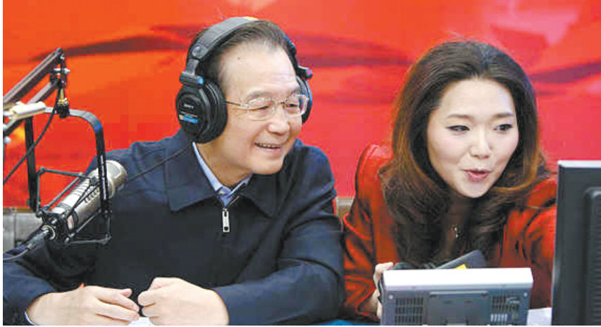
温总理通过电波与全国听众交流