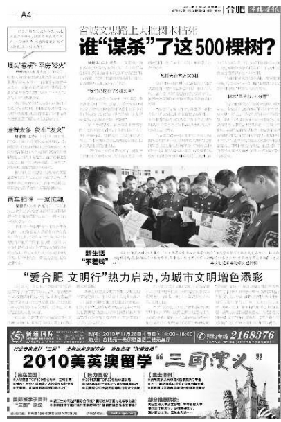
本报关于大量树木枯死的报道