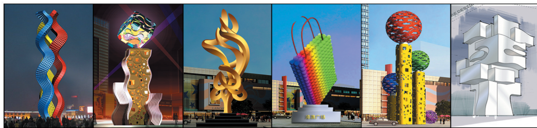
《脉动》 《凝聚, 崛起》 《锦凤飞鸿》 《新时袋》 《盛》 《涌金汇》