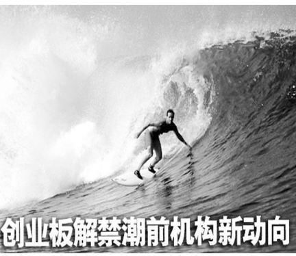
创业板解禁潮前机构新动向

10月30日,创业板将迎来一周岁生日;同时,创业板也将迎来首次解禁洪峰。在首批上市的28只创业板股票中,除宝德股份延长限售期至2012年10月30日外,其余27家合计11.94亿股限售股将于10月30日解禁。因周末原因,上述27只个股将在11月1日或面对一场“腥风血雨”。