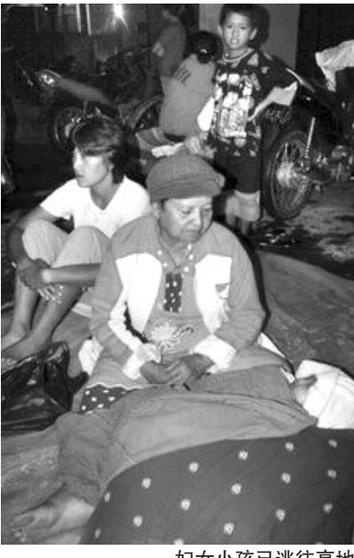
妇女小孩已逃往高地

据驻印尼使馆了解,迄今无中国公民伤亡的报告。印尼地处环太平洋地震带,火山和地震多发,不时引发海啸。2004年12月,印尼亚齐地区发生里氏7.9级强烈地震,引发印度洋大海啸,造成20多万人死亡,50多万人无家可归,其中印尼死亡大约17万人。综合新华社