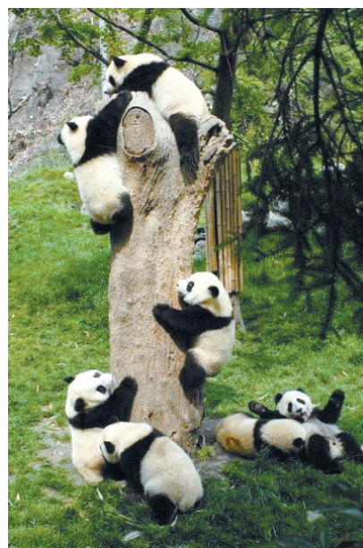
熊猫:正所谓,一将功成万骨枯