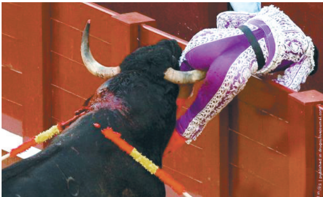
斗牛士:×的,还是慢了一步