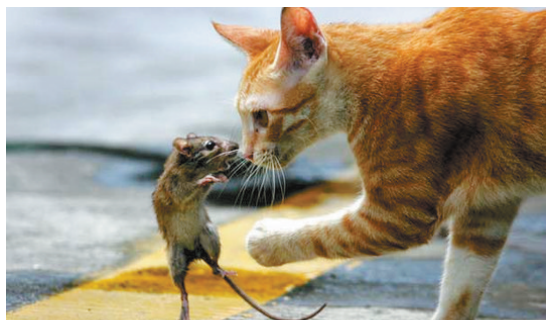
老鼠:不想交朋友算了,没必要拿我当午餐吧?