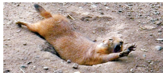
松鼠:大老爷,把俺们这儿的路修修吧