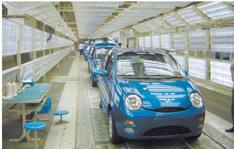
资料图片：奇瑞生产车间(图文无关)