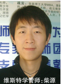
维斯特学管师:柴源