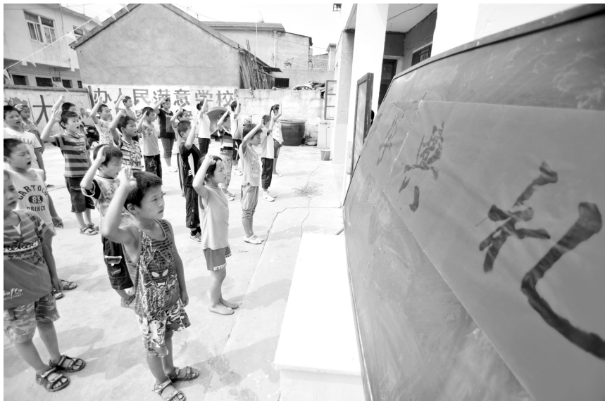
孩子们在简单的开学典礼上唱国歌

求至少1年。而针对这样的规定,记者所了解的情况是,不少农民工很难办到经商或务工证明。手续能不能再简单点,让农民工子女享受到相对公平的教育?带着疑问,记者咨询了合肥市一区属教育局,该局工作人员回道:“既然是工人,怎么能没有劳动合同?证件缺一不可,否则没办法。”