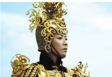
答案依次是:拍摄“枕头的游戏”的五金钗 拍摄摇滚主题写真的陈坤 拍摄《狄仁杰》的刘嘉玲