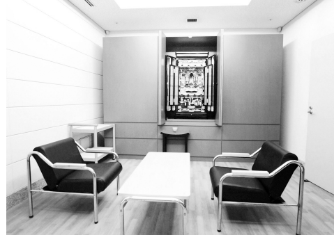
死刑犯受刑前可选择“教诲室”聆听宗教人士教诲