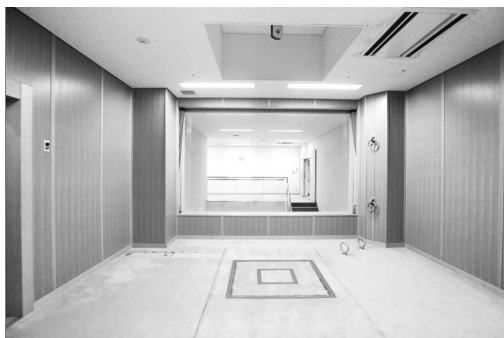
中间踏板打开后,死刑犯瞬间落下,窒息死亡。

日本媒体报道,日本法务省8月27日首次向新闻媒体公开了东京拘留所内的死刑刑场,并首次允许媒体拍照录像。法务大臣千叶景子称,希望借助公开死刑刑场的机会,让日本民众讨论死刑的存废问题。