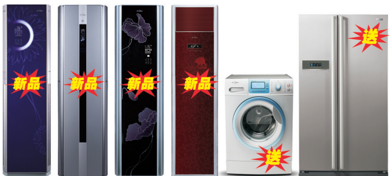
银河F180 银河C180 银河I180 银河K180 美的滚筒洗衣机 凡帝罗对开门冰箱

买空调去美的专卖店，全国连锁，厂家直销！ 本次活动最终解释权归合肥美的制冷产品销售有限公司所有